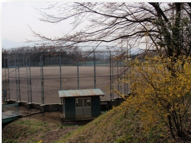
メープルヴィレッジ西、グラウンド 体育施設で、汗を流し、お泊まりはメープルヴィレッジ 少年クラブ等にご利用いただけます。 予約は子持社会体育館