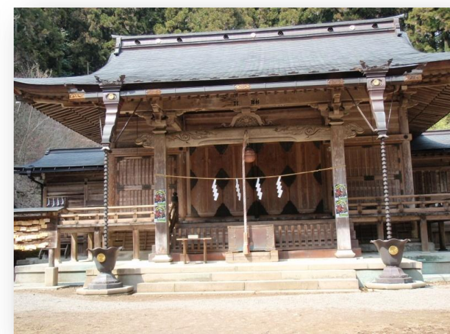
子持神社:メープルヴィレッジから北へ約2キロ 子授け・安産の守護神。 5月1日は子持山、山開きの祭典があります。