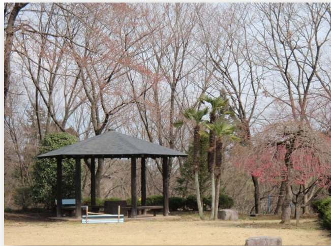
楓山荘の隣接北側、忠霊塔の四阿