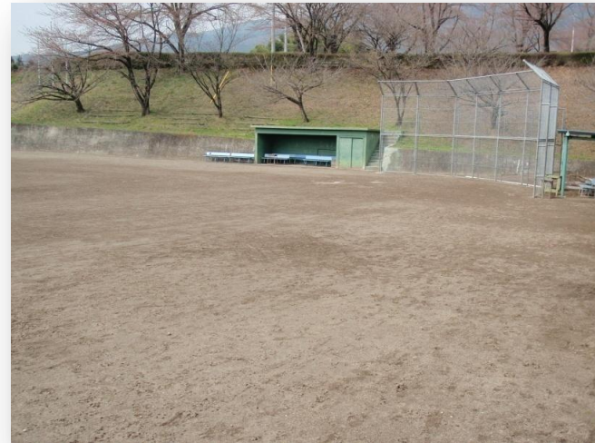
メープルヴィレッジ北、グラウンド 予約は子持社会体育館