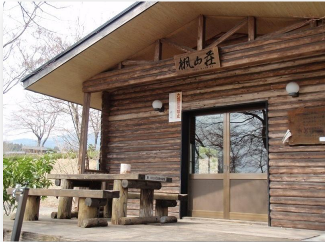
楓山荘、ハイキングの休憩所等にご利用できます 予約は子持社会体育館