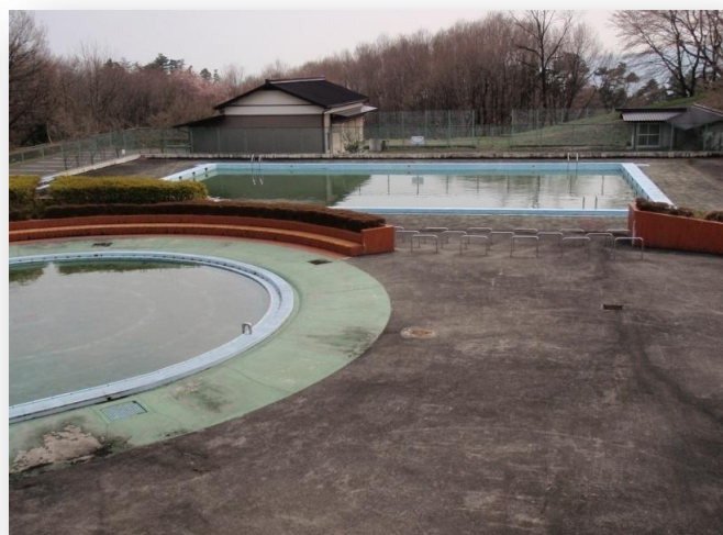
メープルヴィレッジ西、プール7月下旬から8月中旬オープン