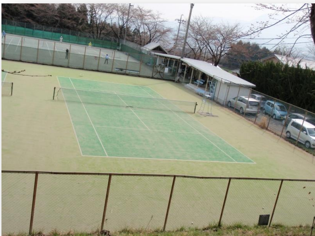
テニスコート4面あり予約は子持社会体育館