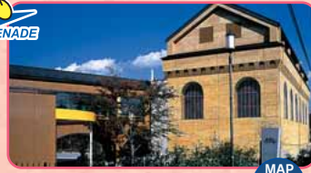
Ikaho Sistine Sanei e Teatro delle scimmie MAP F-4

Il museo espone le opere d'arte contemporanea del Giappone e di altri paesi. Apertura: 9:30-16:30 Giorno di chiusura: nel periodo invernale, nei giorni di allestimento e in caso di condizioni atmosferiche avverse Ingresso: per adulti 1.200 Yen, ed altre condizioni TEL.0279-24-6585