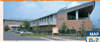
Terme Utopia Akagi MAP D-7

L'acqua di queste terme conosciuta per il suo effetto tonificante per la pelle. Apertura: 9:00-21:00 Giorno di chiusura: il giorno 20 di ogni mese Ingresso: per adulti 400 Yen, ed altre condizioni TEL.0279-59-2611