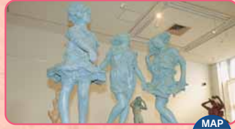
Galleria d'Arte Comunale di Shibukawa - Museo delle sculture di Hiromori Kuwahara MAP Centro Shibukawa

È possibile ammirare le opere ornamentali di Art Nouveau. Apertura: 9:00-17:00 Giorno di chiusura: mercoledì Ingresso: per adulti 1.000 Yen, ed altre condizioni TEL.0279-20-1101