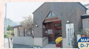
Terme Akagi no yu Fureai no ie MAP D-7

Questa località ebbe sviluppo come stazione di sosta con alberghi, e oggi è possibile fare una piacevole passeggiata. Apertura: 9:00-21:00 Giorno di chiusura: il secondo giovedì del mese Ingresso: per adulti 250 Yen, ed altre condizioni TEL.0279-24-5526