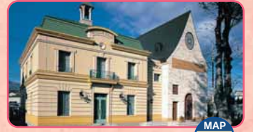
Japan Chanson Hall MAP Centro Shibukawa

In questo piccolo museo al centro della città, i visitatori possono osservare, toccare e comprendere le opere esposte. Apertura: 10:00-18:00 TEL.0279-25-3215