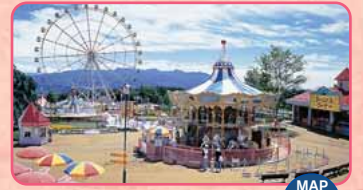
Parco giochi Shibukawa Skyland Park MAP F-4

Museo delle opere d'arte di illusionismo, e spettacoli teatrali interpretati da scimmie. Apertura: 9:30-18:00 Giorno di chiusura: Sempre aperto (Il Teatro delle scimmie potrebbe non tenere rappresentazioni in determinati giorni.) Ingresso: per adulti 1.500 Yen, ed altre condizioni TEL.0279-20-1600