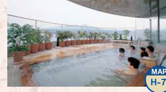
Terme Sky Terme Shibukawa MAP H-7

Vanta di una grande vasca all'aria aperta Apertura: 10:00-21:00 Giorno di chiusura: il secondo martedì del mese Ingresso: per adulti 300 Yen, ed altre condizioni TEL.0279-56-2125