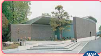
Museo delle opere di artigianato in vetro di Gunma MAP F-4

I visitatori possono vedere da vicino gli animali tenuti in questa fattoria, o perfino toccarli. Apertura: 9:30-17:00 Giorno di chiusura: Chiuso da lunedì a giovedì, da metà gennaio fino alla fine di febbraio (eccetto le festività) Ingresso: per adulti 1.200 Yen, ed altre condizioni * Comprende anche l'ingresso al museo Hara Museum ARC. TEL.0279-24-5335