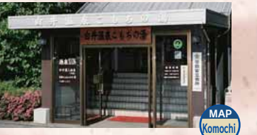
Terme di Shiroi, Komochi no yu MAP Komochi

Da queste terme possibile ammirare l'esteso panorama della pianura Kanto. Apertura: 10:00-21:00 Giorno di chiusura: il secondo e quarto martedì del mese Ingresso: per adulti 300 Yen, ed altre condizioni TEL.0279-60-1126