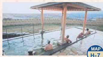
Terme di Hokkitsu, Bando no yu MAP H-7

Oltre alle vasche di grandi dimensioni, sono presenti anche vasche per le gambe e piscina con acqua calda termale. Apertura: 10:00-21:00 Giorno di chiusura: il secondo mercoledì del mese Ingresso: per adulti 500 Yen, ed altre condizioni TEL.0279-56-4126