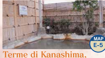
Terme di Kanashima, Fuuki no yu MAP E-5

Si può ammirare il panorama da un'altezza di 15 m. Apertura: 10:00 - 21:00 Giorno di chiusura: il secondo martedì del mese Ingresso: per adulti 500 Yen, ed altre condizioni TEL.0279-20-1126