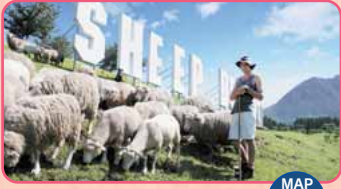
Tenuta della fattoria Ikaho Green Bokujo MAP F-4

Luna park da cui si può ammirare l'esteso panorama della pianura Kanto Apertura: 9:00-17:00 Giorno di chiusura: Chiuso occasionalmente durante l'inverno Un biglietto di giorno: per adulti 1.700 Yen, ed altre condizioni TEL.0279-20-1589