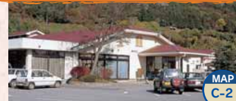
Centro termale Onogami MAP C-2

L'acqua di queste terme conosciuta per il suo effetto tonificante per la pelle. Apertura: 9:00-21:00 Giorno di chiusura: il giorno 20 di ogni mese Ingresso: per adulti 400 Yen, ed altre condizioni TEL.0279-59-2611