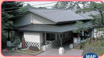
Museo commemorativo di Roka Tokutomi MAP Ikaho

Lungo la strada in salita che ha inizio dal centro di Shibukawa fino alle Terme di Ikaho, sono affiancati numerosi musei d'arte e siti turistici.