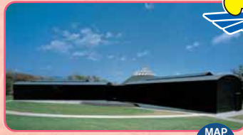
Hara Museum ARC MAP F-4

Questo museo è dedicato per celebrare l'autore Roka Tokutomi vissuto nel periodo Meiji. Apertura: 8:30-17:00 Giorno di chiusura: dal 25 al 29 dicembre Ingresso: per adulti 350 Yen, ed altre condizioni TEL.0279-72-2237